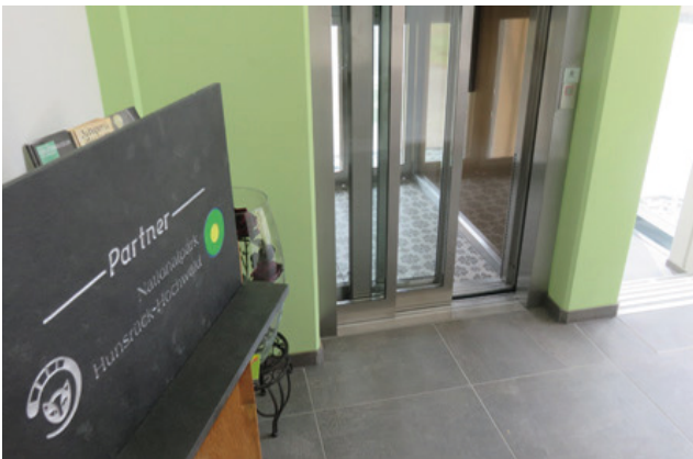
Großformatiges Feinsteinzeug in Schieferoptik im Eingangsbereich des Diamantheotel Handelshof: Feuchtigkeitsbeanspruchung in diesem Bereich ist so kein großes Problem.