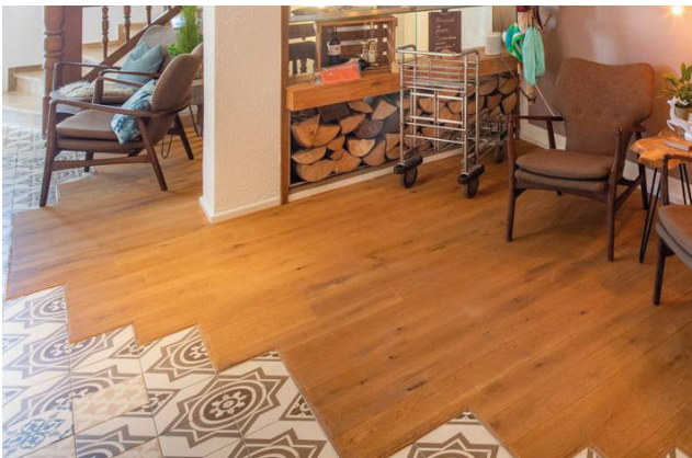
Mit einer raffinierten Kombination aus Retro-Musterfliesen und Eichenlandhausdielenparkett ist das Landhotel Saarschleife in Mettlach ausgestattet.