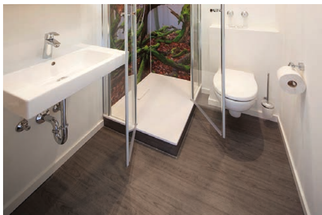
Als Alternative zu Fliesen hat sich das Hotel zur Post in Kell am See im Sanitärbereich für einen Designbelag in Holzoptik entschieden. Kombiniert mit einem Bild aus dem Nationalpark, duscht man so quasi in der Natur.