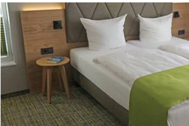
Strukturierter Teppichboden im Diamantheotel in Idar-Oberstein ist nicht nur warm für die Füße, sondern ist auch ein Hingucker!