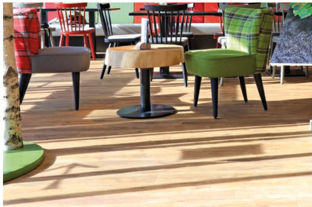
Ebenfalls mit schönem Boden kommt das Café Kelte Katz in Nohfelden daher.