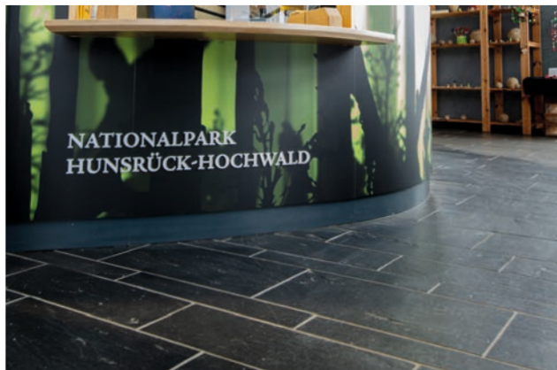
Echten Schiefer finden Sie als Bodenbelag im Hunsrückhaus am Nationalpark-Tor Erbeskopf. Auch bei starker Beanspruchung ist Schiefer eine gute Wahl!