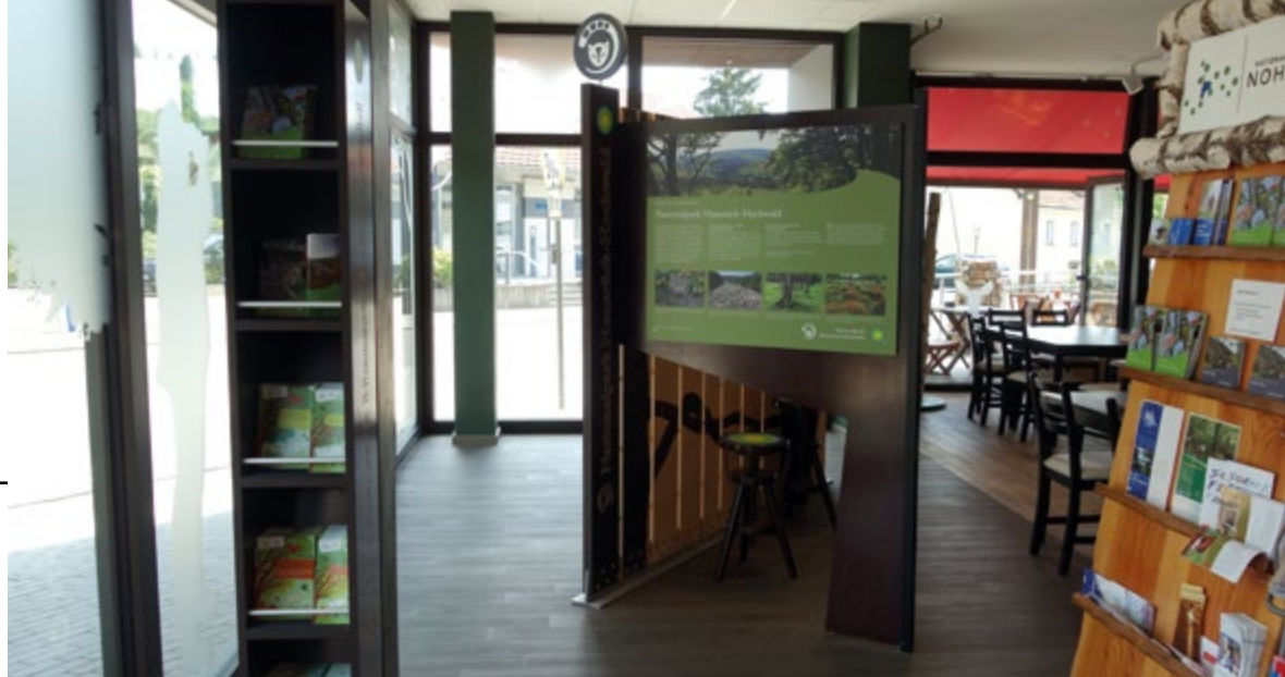
Inneneinrichtung des Café Kelte Katz mit Informationen zum Nationalpark Hunsrück-Hochwald