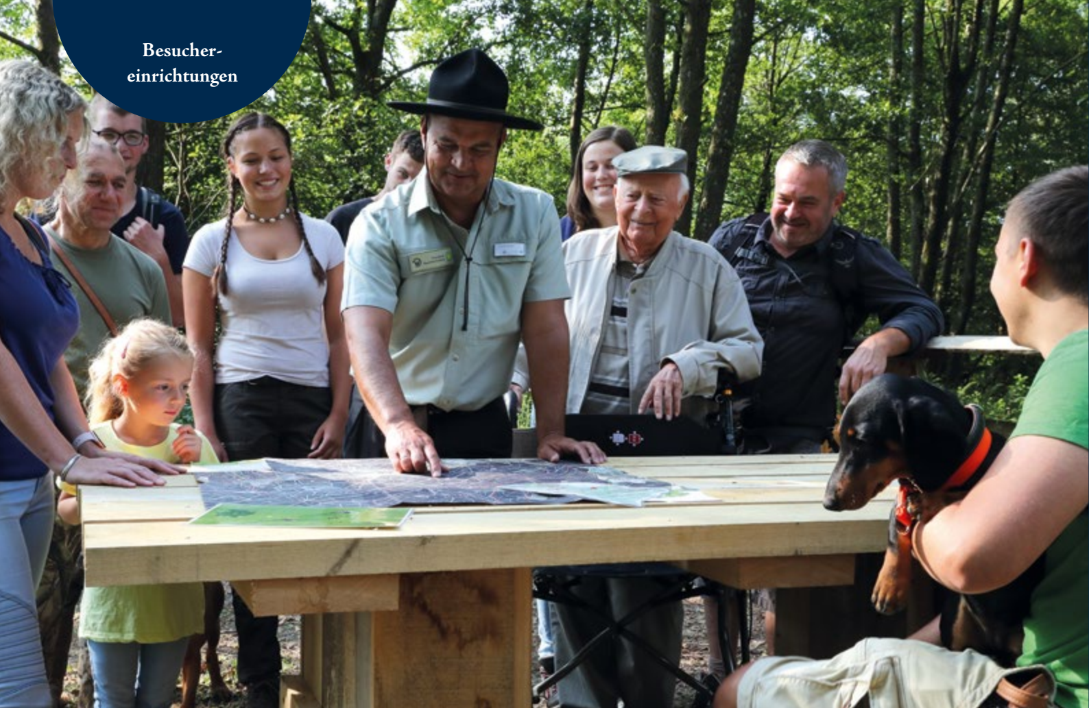
Rangertour im Nationalpark Hunsrück-Hochwald