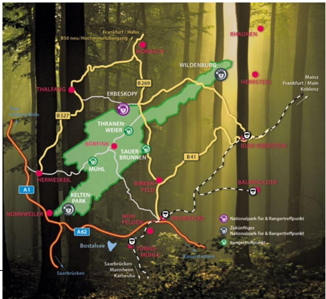
Nationalpark-Tore und Rangertreffpunkte

Mit den Nationalpark-Toren sollen attraktive, authentische Orte für die Gäste geschaffen werden, die im Sinne einer nachhaltigen Entwicklung mit gutem