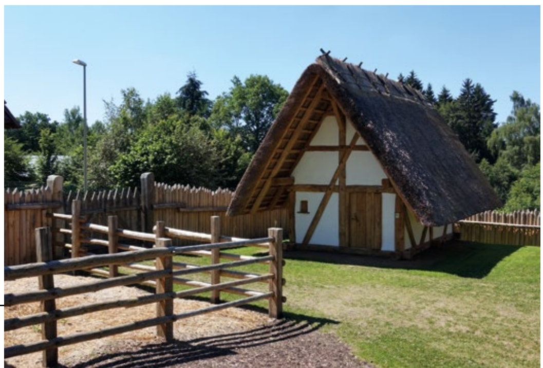
Zukünftiges Nationalpark-Tor Keltenpark

Das Land Rheinland-Pfalz prüft derzeit die Übernahme des Wildfreigeheges Wildenburg, so dass dieses zukünftig vom Nationalparkamt zu einem Nationalpark-Tor weiterentwickelt werden kann. Bis Anfang 2020 werden dazu Entscheidungs-, Verhandlungs- und Planungsgrundlagen vorliegen. Zu diesen gehören insbeson-